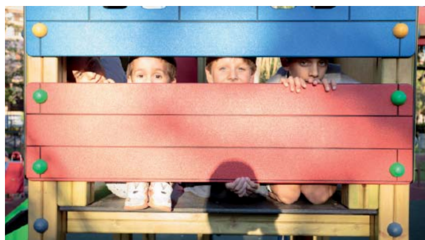
CASITA PUERTAS ABIERTAS (CON TOBOGÁN INOX) PLAYHOUSE "OPEN-DOOR" (WITH SLIDE OF STAINLESS STEEL) CABANE "PORTE-OUVERTE" (AVEC TOBOGGAN INOX)